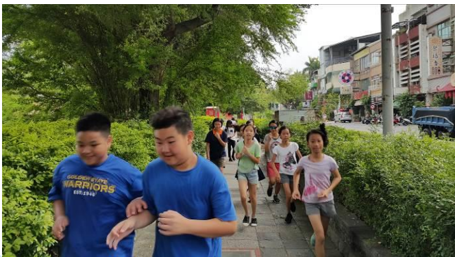
晨間跑步-跑的超開心