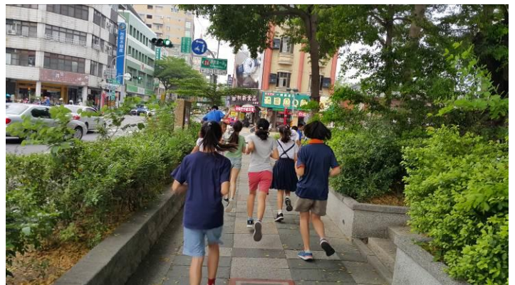
週一、週三晨間 08:00-08:30 學生跑步