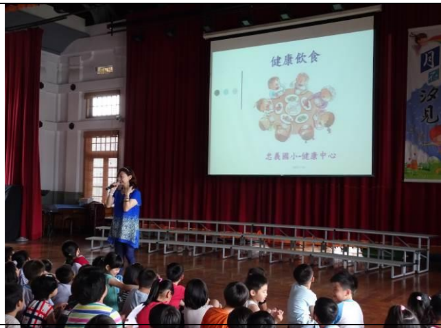
說明體重與飲食的關係—要減重就要先控制飲食。