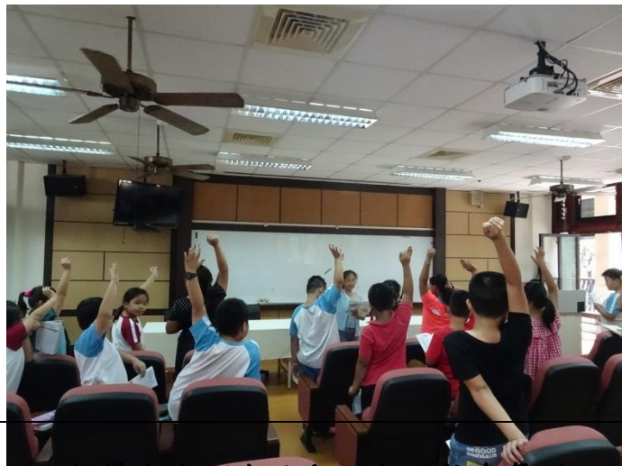
教導在家可自己動一動的熱身舞蹈