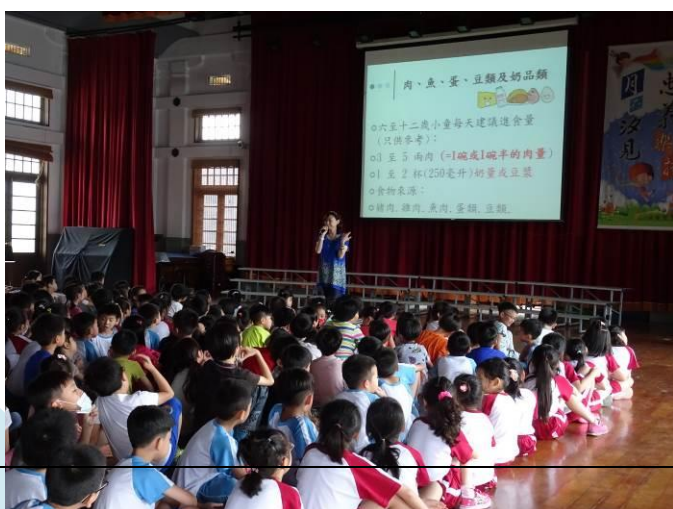
認識五大類食物：多攝取綠燈食物。