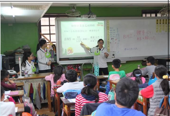
介紹 BMI 算法