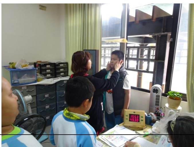
先來量量體重再給自己立下目標喔