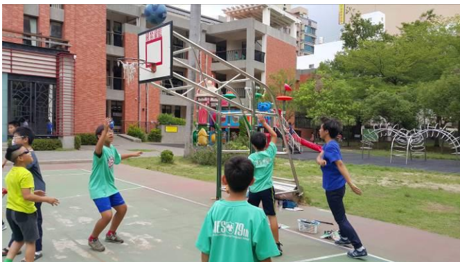
體重過重學生球類活動