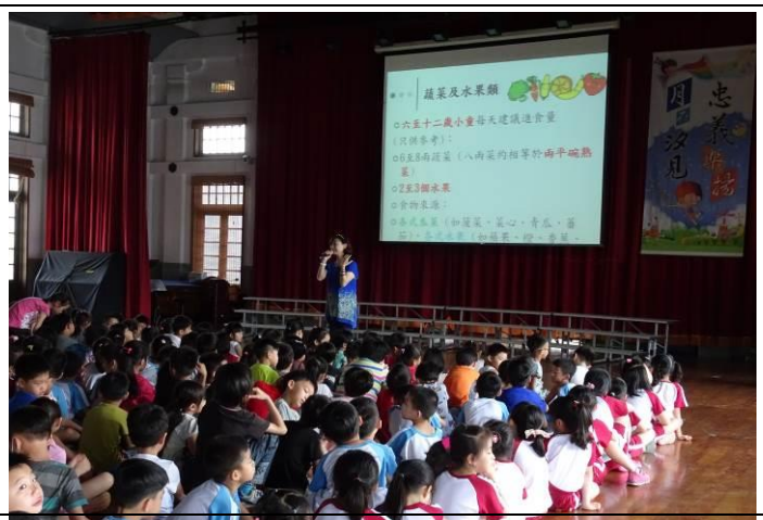
便當熱量比一比，讓兒童瞭解如何選擇對自己健康有益的食品。