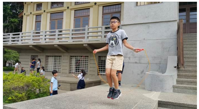
體重過重學生跳繩活動