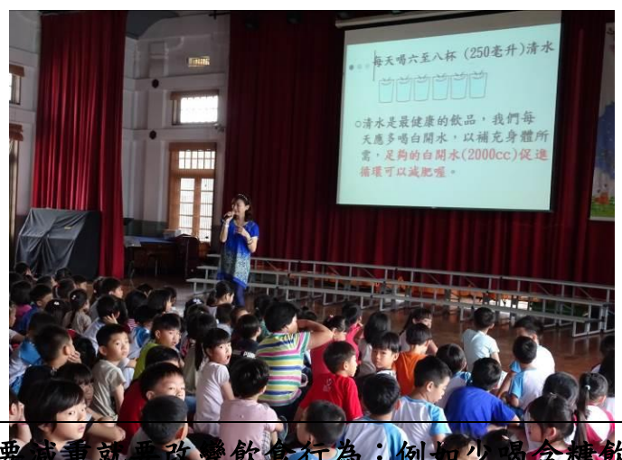
要減重就要改變飲食行為：例如少喝含糖飲料、多喝白開水、多動少吃…。