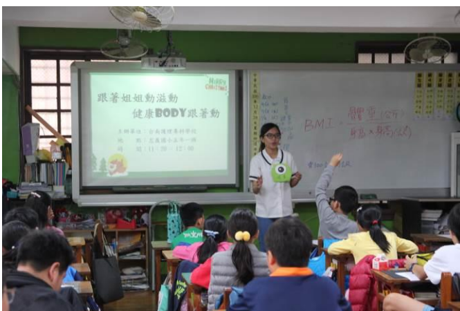
健身操帶動及問答