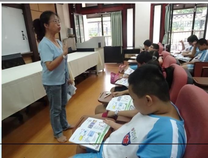
讓孩子們了解肥胖對身體的殺傷力