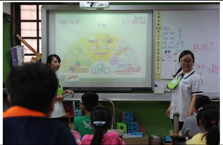
介紹七大營養素及其功用