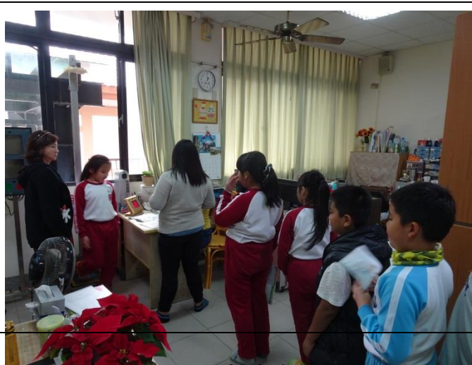
每個人都要量體重了解自己